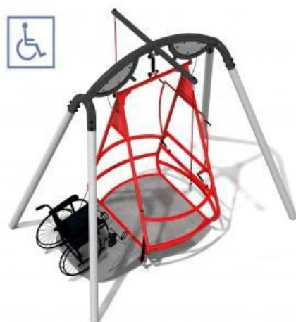
3 - HUŚTAWKA DLA NIEPEŁNOSPRAWNYCH SATURN