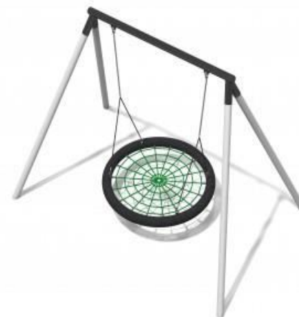
2 - HUŚTAWKA WAHADŁOWA LOTUS